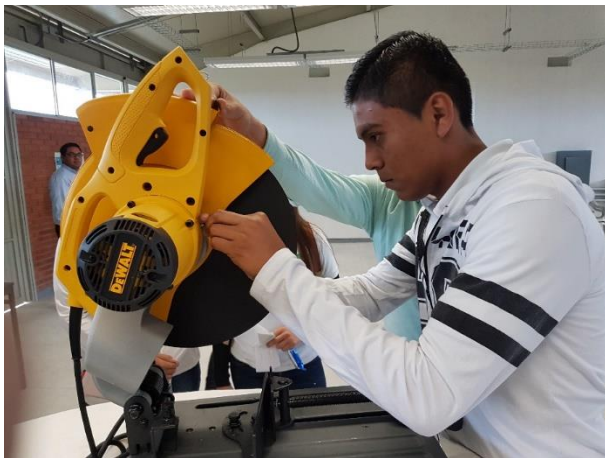
Equipamiento terminado el campus Tamuín.