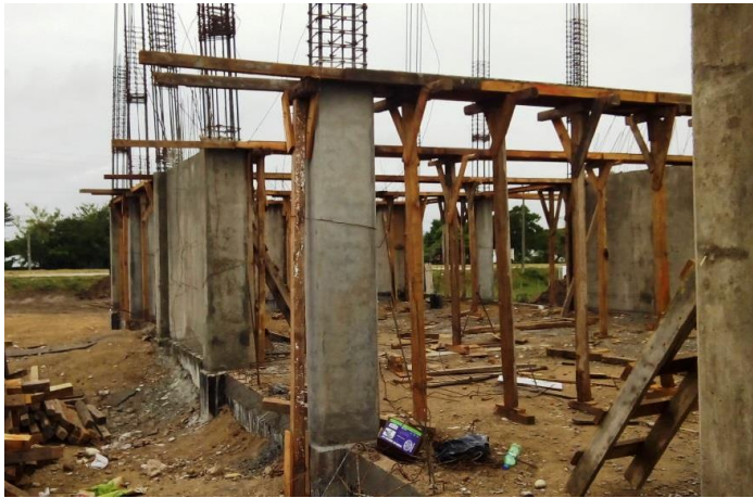
Obra en proceso el campus Tanquián de Escobedo.