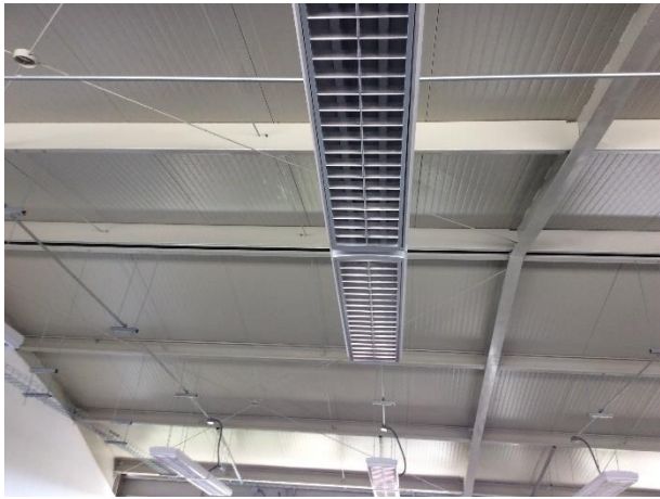
Obra terminada el campus Tamuín.