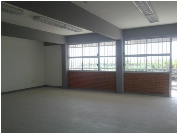
Obra terminada el campus Ciudad Valles.